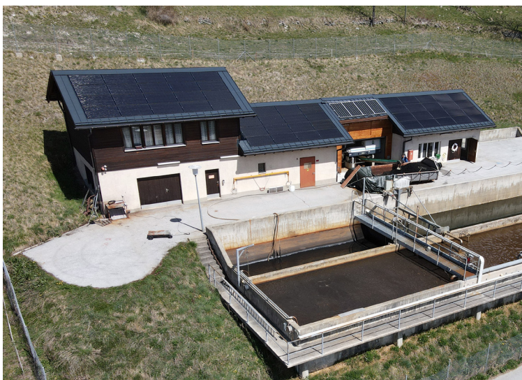
Les panneaux solaires de la Step de Saint-Martin 18.64 kW de puissance pour 103.60 m 2 de surface.

Aujourd'hui, plus de 460 communes de toute la Suisse sont certifiées Cité de l'énergie (ce qui représente environ 60% de la population suisse). Saint-Martin, au même titre que toutes ces autres communes, souhaite démontrer qu'elle s'occupe activement et de manière innovante de l'énergie, du climat, des transports et de l'environnement sur son territoire. ■